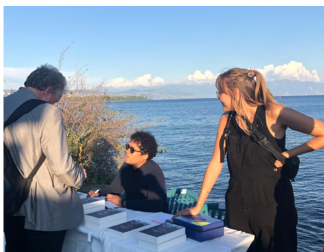
Séance de dédicace sur les quais de Morges