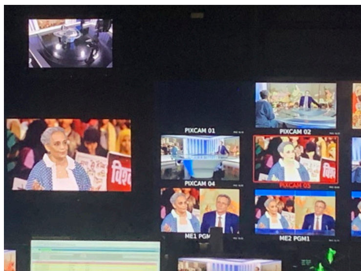
Studio de la Télévision Suisse Romande à Genève

Il convient de souligner le fait que les dossiers de presse sont diffusés en langue française, anglaise, allemande, ce qui contribue certainement au rayonnement du Prix Européen de l'Essai.