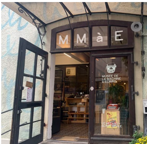
Musée de la Machine à écrire à Lausanne

29 novembre 2023 : Nous colonisons l'avenir de David van Reybrouck Éditions Actes Sud, 2023