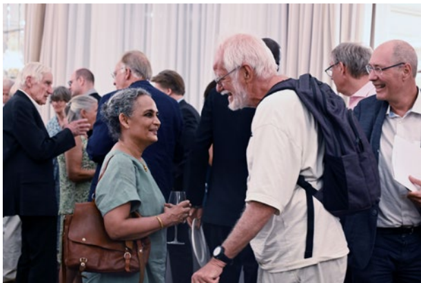
Arundhati Roy et Jacques Dubochet