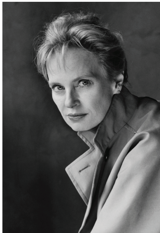
Cliquer sur l'image pour télécharger le fichier haute résolution

pour son livre «Les Mirages de la certitude» paru chez Actes Sud, 2018.